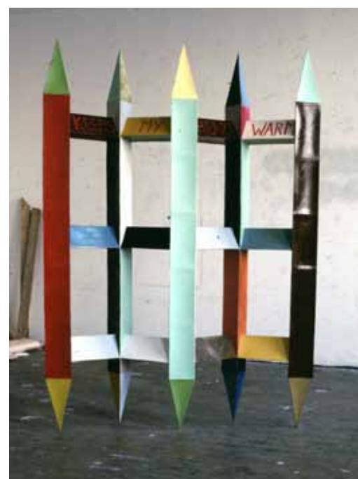
Fancy Fence 1987, karton en lakverf, 200cm hoog, vernietigd