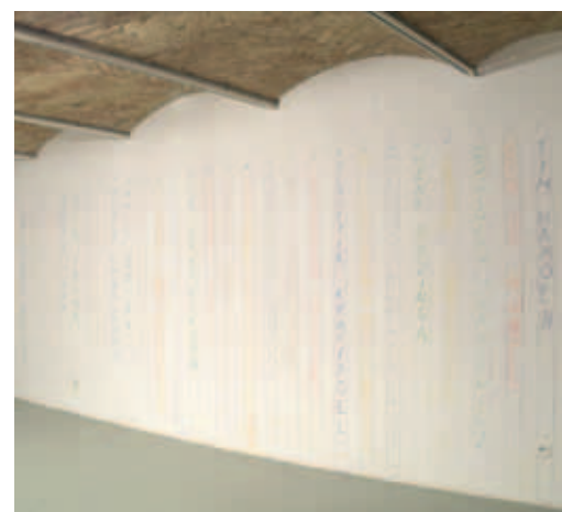
Opslagpanorama, installatie, Argument, 2011